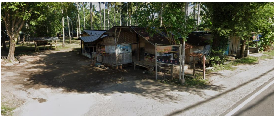
Gambar 6. Papan informasi “Pantai Duduk” di pintu masuk kawasan pantai

Meskipun secara infrastruktur dan posisi strategis Pantai Duduk unggul, serta didukung kemudahan teknologi navigasi digital, kendala teknis pada aspek informasi dan penandaan fisik tetap perlu mendapat perhatian. Papan nama atau petunjuk arah menuju Pantai Duduk kurang terlihat dengan jelas, terutama akibat faktor topografi jalan yang berupa tikungan dan turunan. Kondisi geografis ini menyebabkan papan nama yang terpasang seringkali terlewat begitu saja karena pandangan pengemudi terfokus pada navigasi melewati tikungan atau menuruni jalan, sementara kecepatan kendaraan yang cukup tinggi di jalan beraspal mulus memperbesar kemungkinan terlewatnya penanda tersebut. Perlu dicatat bahwa papan petunjuk sebenarnya telah tersedia dan dipasang di tepi jalan masuk menuju pantai, namun posisinya yang kurang strategis dan ukurannya yang kurang memadai menyebabkan fungsinya sebagai penanda tidak optimal, terutama bagi pengendara yang melintas dari arah tertentu atau dalam kecepatan tinggi. Meskipun GPS dapat memandu wisatawan yang secara aktif mencari destinasi, papan nama fisik tetap penting untuk menangkap wisatawan impulse yang melintas tanpa persiapan navigasi sebelumnya.