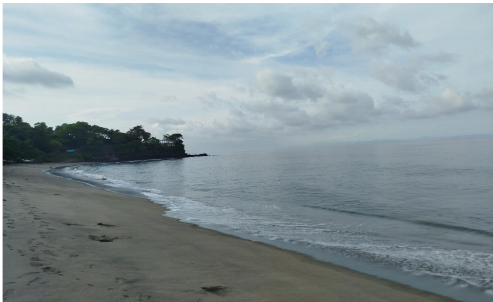
Gambar 1. Pemandangan Pantai Duduk di sebelah timur

Daya tarik wisata merupakan segala keunikan yang menjadi alasan pengunjung untuk datang ke suatu destinasi. Kawasan Pantai Duduk memiliki daya tarik wisata yang cukup lengkap dan terintegrasi, meliputi empat komponen utama yaitu something to see , something to do , something to buy , dan something to learn .