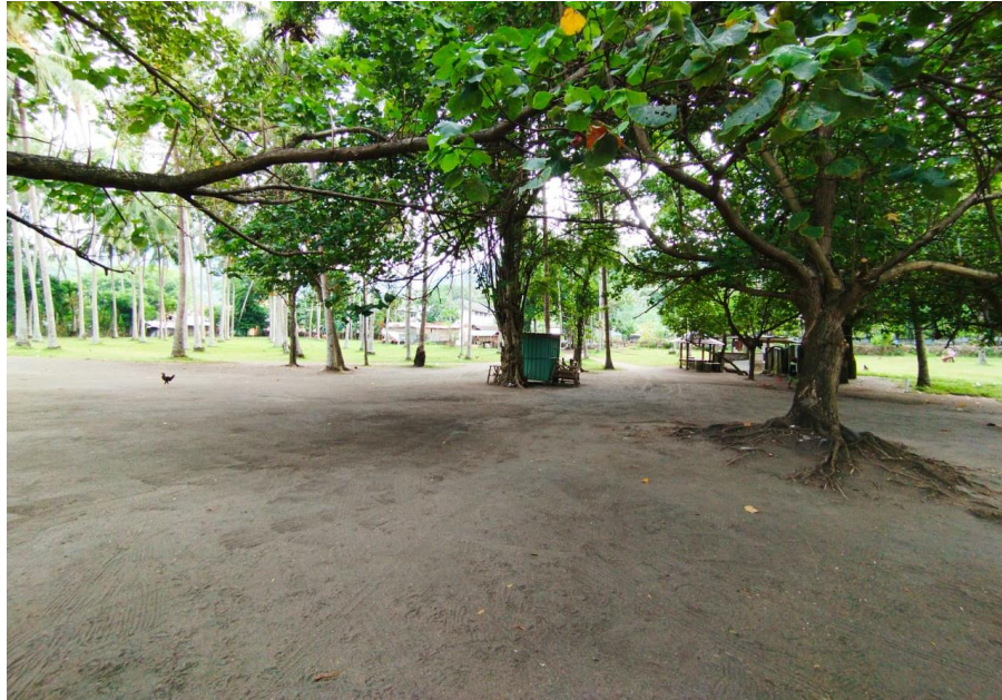
Gambar 3. Lahan parkir yang sangat luas, tetapi tidak ada petugas parkir

Kelengkapan fasilitas atau amenities merupakan komponen vital dalam menunjang kenyamanan dan kepuasan wisatawan selama berkunjung ke suatu destinasi. Di kawasan Pantai Duduk, ketersediaan fasilitas menunjukkan kondisi yang timpang, di mana beberapa aspek telah terpenuhi dengan baik, namun di sisi lain masih terdapat kekurangan mendasar yang perlu mendapat perhatian serius.