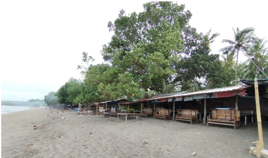
Gambar 4. Fasilitas warung makan, tempat duduk dan gazebo di sepanjang pantai