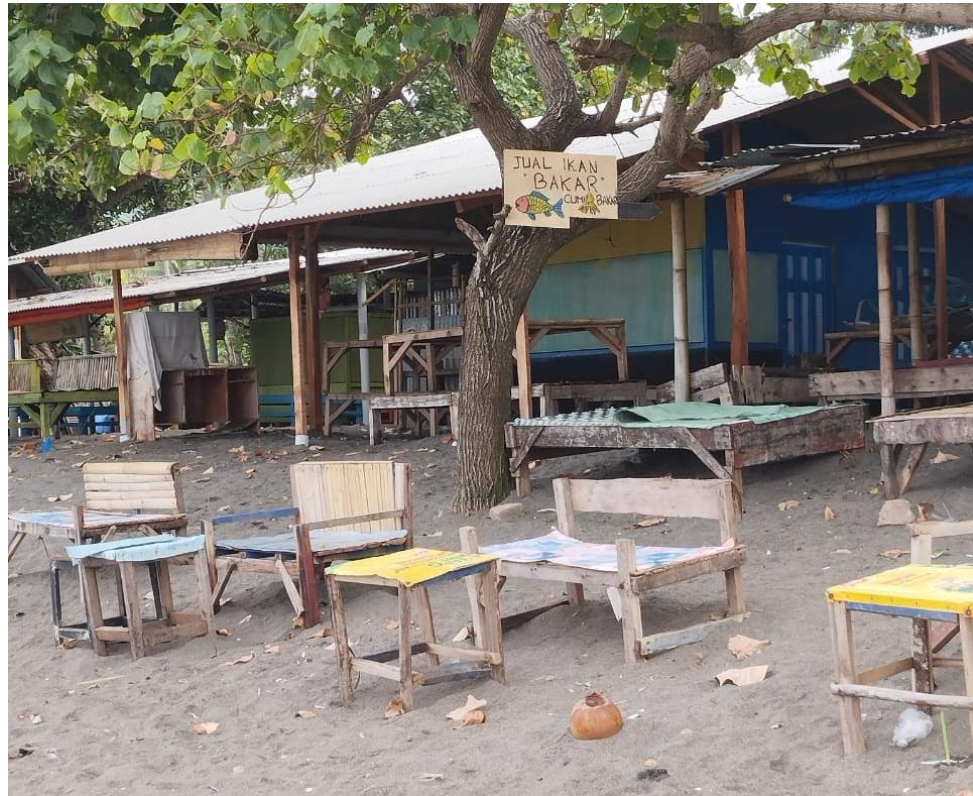
Gambar 4. Lapak penjual ikan bakar di tepi pantai (Lapak tutup karena sedang bulan Ramadhan)

Dari hasil observasi lapangan, terdapat sejumlah fasilitas yang telah tersedia dan berfungsi cukup baik dalam melayani kebutuhan wisatawan. Keberadaan warung makan lokal menjadi fasilitas utama yang menunjang komponen kuliner, di mana pengunjung dapat menikmati berbagai hidangan khas seperti ikan bakar, jagung bakar, dan Sate Bulayak. Selain itu, banyak dijumpai gazebo atau selasar milik warga yang tersebar di sepanjang kawasan pantai. Hal yang menarik, area parkir di Pantai Duduk tergolong sangat luas dan mampu menampung kendaraan roda dua maupun roda empat dalam jumlah besar, terutama saat musim liburan tiba, yang menjadi nilai tambah mengingat keterbatasan lahan parkir kerap menjadi keluhan utama di banyak destinasi wisata pantai lainnya. Untuk menunjang aktivitas rekreasi air, tersedia pula fasilitas sewa ban yang dapat digunakan pengunjung untuk bermain air atau sekadar mengapung menikmati deburan ombak.