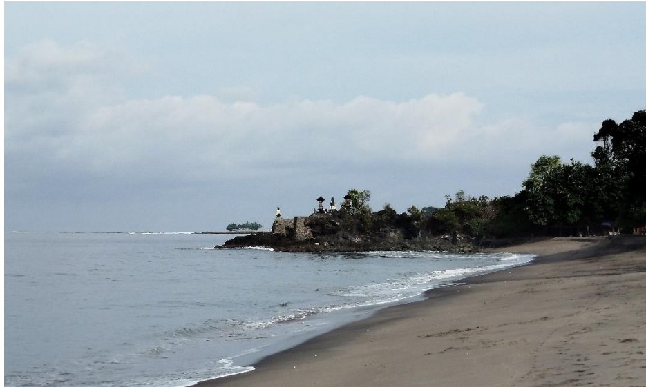
Gambar 2. Pemandangan Pantai Duduk dan kenampakan Pura di sisi barat pantai

Komponen something to see di Pantai Duduk tercermin dari keindahan bentang alamnya, terutama pemandangan sunset yang ikonik serta eksotisme Pura yang terletak di sisi barat pantai. Keberadaan pura ini tidak hanya memperkaya nilai estetika lanskap, tetapi juga memberikan dimensi spiritual dan budaya pada kawasan tersebut. Dari aspek something to do , destinasi ini menawarkan berbagai aktivitas rekreasi yang dapat dilakukan pengunjung, meliputi aktivitas pantai seperti berenang, memancing, dan bermain bola, serta aktivitas menunggang kuda di sepanjang garis pantai. Variasi aktivitas ini menunjukkan bahwa Pantai Duduk berfungsi sebagai ruang rekreasi aktif yang mampu mengakomodasi berbagai minat wisatawan.