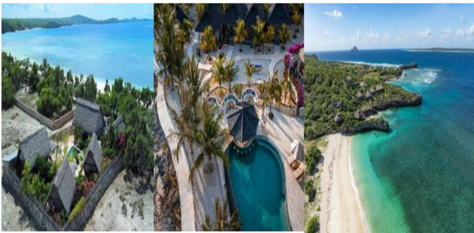
Gambar 1. Peta Desa Bo'a

Pantai Bo'a merupakan ruang alamiah yang telah menjadi bagian integral dari kehidupan masyarakat adat di Desa Bo'a. Berdasarkan wawancara dengan aparat desa, pantai ini tidak dibentuk oleh kekuasaan tertentu, tetapi hadir secara alami dan diwariskan sebagai bagian dari ruang hidup kolektif masyarakat. Bagi nelayan tradisional, pantai merupakan titik awal untuk pergi melaut dan menjadi tempat beraktivitas. Meskipun tidak ada sistem kepercayaan adat formal dalam pengelolaan pantai, masyarakat memahami secara kolektif bahwa pantai memiliki fungsi ekologis sebagai habitat sumber daya laut, fungsi spiritual sebagai ruang sakral, serta fungsi kultural sebagai ruang sosial. Di sinilah praktik gotong royong tumbuh, anak-anak bermain, dan relasi sosial antar warga dibentuk.