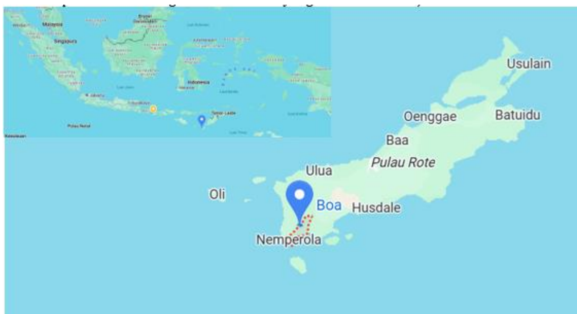
Gambar 1: Lokasi Penelitian

Sementara itu, metode etnografi digunakan untuk mengamati secara langsung praktik budaya, nilai-nilai sosial, serta relasi kuasa antara masyarakat adat dan aktor eksternal seperti investor dan pemerintah. Pendekatan etnografi juga berfungsi mengungkap dimensi simbolik dan naratif resistensi budaya masyarakat lokal terhadap perubahan sosial yang terjadi. Penelitian dilaksanakan di Desa Bo'a, Kecamatan Rote Barat, Kabupaten Rote Ndao, Provinsi Nusa Tenggara Timur. Lokasi ini dipilih secara purposif karena menjadi pusat aktivitas pariwisata sekaligus kawasan adat yang masih aktif menjalankan tradisi.