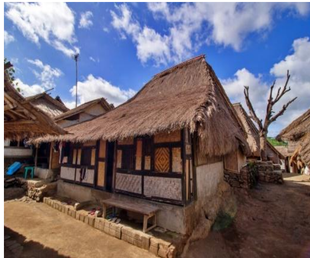
Gambar 2. Rumah Adat

Rumah Adat Sade adalah rumah tradisional masyarakat Suku Sasak yang berada di Dusun Sade, Desa Rembitan, Kabupaten Lombok Tengah, Nusa Tenggara Barat. Rumah ini dibangun menggunakan bahan-bahan alami seperti kayu, bambu, alang-alang untuk atap, dan lantai tanah yang dipadatkan dan dibersihkan dengan campuran kotoran kerbau untuk menjaga kelembapan dan kebersihan. Arsitektur Rumah Adat Sade mencerminkan nilai-nilai budaya, filosofi hidup, serta tatanan sosial masyarakat Sasak. Bentuknya sederhana namun sarat makna, seperti orientasi bangunan yang mengikuti arah mata angin dan tinggi rendah bangunan yang menunjukkan status sosial penghuninya. Rumah ini bukan sekadar tempat tinggal, tetapi juga menjadi simbol identitas budaya yang dilestarikan secara turun-temurun oleh masyarakat setempat