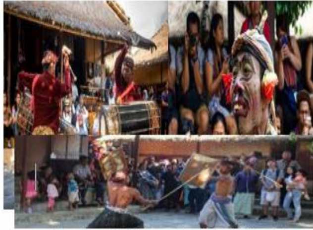
Gambar 3. Kesenian Tradisional