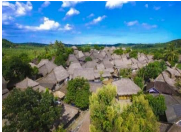
Gambar 5. Lingkungan Pedesaan Sade