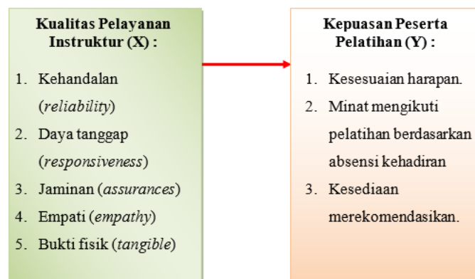
Gambar 1. Kerangka Pemikiran

Kerangka berpikir adalah suatu model konseptual tentang bagaimana teori-teori hubungan dengan beberapa faktor yang akan didefinisikan sebagai suatu permasalahan berdasarkan rumusan permasalahan (Sekaran, 2006:19), maka hubungan antara Kualitas Pelayanan, fasilitas dan kepuasan digambarkan sebagai berikut: