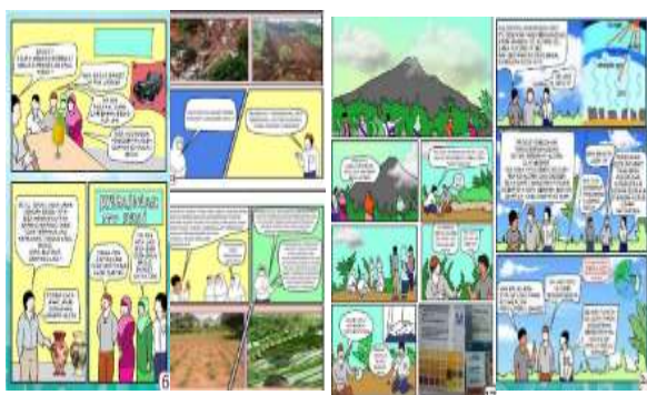
Gambar 7. Contoh representasi kecerdasan naturalis

Kecerdasan naturalis adalah kecerdasan yang melibatkan simpati seseorang terhadap kelestarian lingkungan. Kegiatan pembelajaran IPA untuk meningkatkan kecerdasan naturalis siswa adalah siswa diajak menjelajahi alam dan mengidentifikasi hal-hal apa saja yang dapat digunakan untuk materi pembelajaran sains yang akan dibahas bersama. Salah satu contoh representasi kecerdasan naturalis dapat dilihat pada gambar 7.