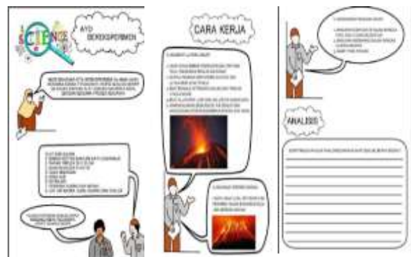
Gambar 4. Representasi kecerdasan kinestetik

Kecerdasan kinestetik terkait dengan gerakan anggota tubuh seperti melakukan percobaan. Kecerdasan ini merupakan kapasitas untuk mengontrol gerakan tubuh seseorang dan menangani objek dengan terampil. Representasi kecerdasan kinestetik dapat dilihat pada gambar 4.