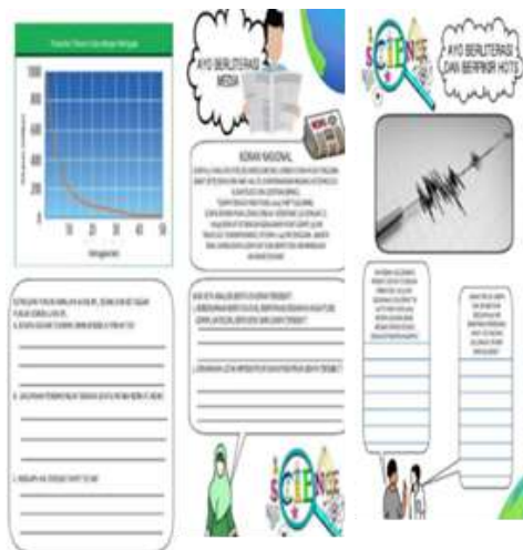
Gambar 3. Contoh representasi kecerdasan matematis

Kecerdasan matematik sangat ditentukan oleh materi yang dibahas di dalam komik. Khusus komik Sains yang dianalisis tidak begitu banyak membahas tentang kecerdasan logis karena materi yang komik lebih ke arah teoritik dan bukan hitungan. Representasi kecerdasan logis dapat dilihat pada gambar 3.