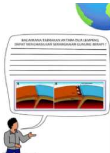
Gambar 5. Representasi kecerdasan Interpersonal

Interpersonal terhubung dengan memahami dan berinteraksi dengan orang lain. Para siswa belajar melalui interaksi. Mereka punya banyak teman, empati terhadap orang lain, orang-orang cerdas jalanan. Mereka dapat diajar melalui kegiatan kelompok, seminar, dialog. Peralatan termasuk telepon, konferensi audio, waktu dan perhatian dari instruktur, konferensi video, menulis, konferensi komputer, email.