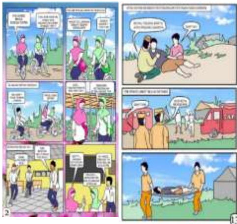
Gambar 6. Contoh representasi kecerdasan intra personal