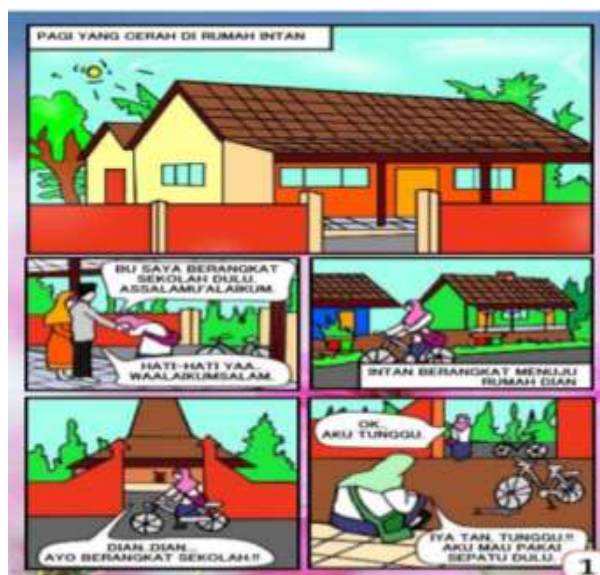
Gambar 2. Contoh Representasi kecerdasan verbal.

Kecerdasan ini juga mendominasi kedua setelah kecerdasan visual karena komik merupakan kumpulan gambar dan tulisan yang membentuk suatu cerita (Widyawati & Listiyani, 2018). Representasi kecerdasan verbal dapat dilihat pada gambar 2.