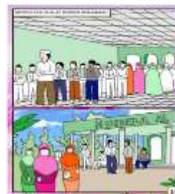
Gambar 8. Contoh representasi kecerdasan eksistensial

Representasi kecerdasan eksistensial dalam komik dapat ditemukan dalam bentuk gambar orang yang sedang sholat di masjid, berdoa sebelum memulai pelajaran, mengucapkan salam untuk keselamatan, mensyukuri nikmat Allah seperti nampak pada gambar 8.