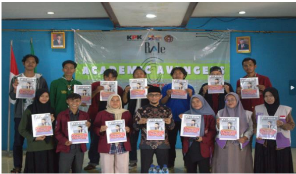
Gambar 3. Dokumentasi Sosialisasi Komik Digital