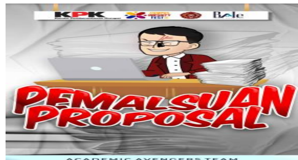
Gambar 4. Cover Komik Digital: Pemalsuan Proposal

Komik kode etik antikorupsi ini merupakan salah satu pendorong kesadaran kepada mahasiswa terhadap penyimpangan dan manipulasi yang melanggar hukum dan dilakukan dengan sengaja. Mahasiswa sebagai agent of change berperan penting dalam memperluas pengetahuan, salah satunya dengan menulis dapat menjadi jembatan bagi mahasiswa untuk menyampaikan keinginan dan pesan kritik terhadap kebijakan - kebijakan yang melanggar norma. Meskipun pesan kritik umumnya memiliki beberapa kekurangan. Namun, dalam kacamata seni, komik dan tulisan dianggap alat yang efektif dan menarik untuk memvisualisasikan informasi yang sedang hangat dibicarakan.