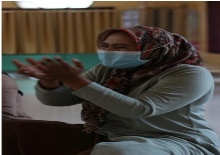
Gambar 1. Praktek Mencuci Tangan