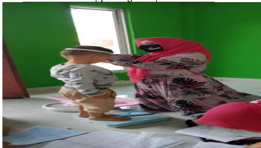
Gambar 3. Pelaksanaan Posyandu Sesuai Prosedur Pada Masa Pandemi Covid 19