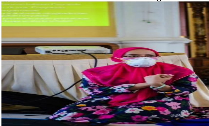
Gambar 2. Anggota Tim Menjelaskan Panduan Pelaksanaan Posyandu Pada Masa Pandemic Covid 19

Setelah dilaksanakan kegiatan sosialisasi ini pada bulan berikutnya kader posyandu kembali melaksanakan posyandu sesuai dengan panduan kegiatan yang telah dijelaskan Tim kegiatan Pengabdian. Tingkat pemahaman selama mengikuti acara sosialisasi pelaksanaan posyandu pada masa covid 19 dapat terukur dalam bentuk tabel sebagai berikut: