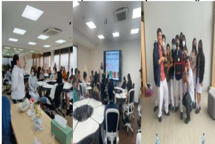
Gambar 2. Pembelajaran oleh dosen prodi Manajemen