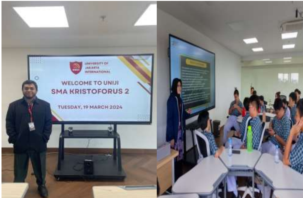
Gambar 4. Pembelajaran oleh dosen prodi Rekayasa Perangkat Lunak dan prodi Data Sains