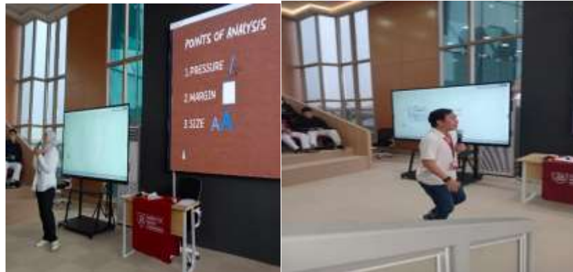
Gambar 1. Pembelajaran oleh dosen prodi Psikologi