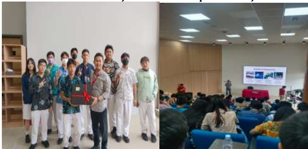
Gambar 3. Pembelajaran oleh dosen prodi Akuntansi