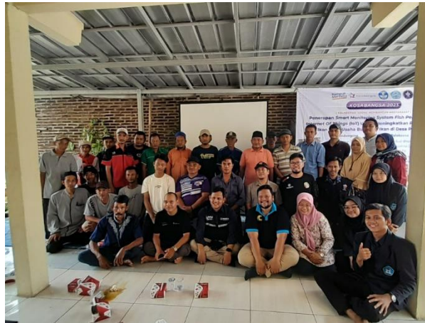
Gambar 2. Peserta kegiatan sosialisasi kewirausahaan

Di akhir sesi diberikan angket terkait pemahaman peserta mengenai kewirausahaan. Terdapat peningkatan pemahaman kewirausahaan yang dialami peserta yaitu sebelum mengikuti kegiatan 32% dan setelah mengikuti kegiatan 68%. Sehingga terdapat peningkatan pemahaman kewirausahaan sebesar 36 %. Hasil repon positif yang dialami peserta juga cukup baik. Hal ini terbukti peserta sangat antusias dan sekarang sudah tidak ragu lagi dalam berwirausaha. Karena peserta sudah memiliki modal yang cukup dalam budidaya ikan. Hasil peningkatan pemahaman kewirausahaan dapat dilihat pada gambar 3 berikut.