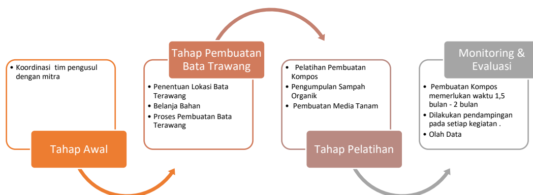
Gambar 2. Diagram Kegiatan PKM

Evaluasi dan monitoring kegiatan dilakukan secara kontinyu, pembuatan kompos memerlukan waktu yang cukup lama antara 1,5 bulan hingga 2 bulan. Sehingga pendampingan akan terus dilakukan. Pada tahap ini juga dilakukan pengolahan data tentang pengetahuan ( pretest-posttest )