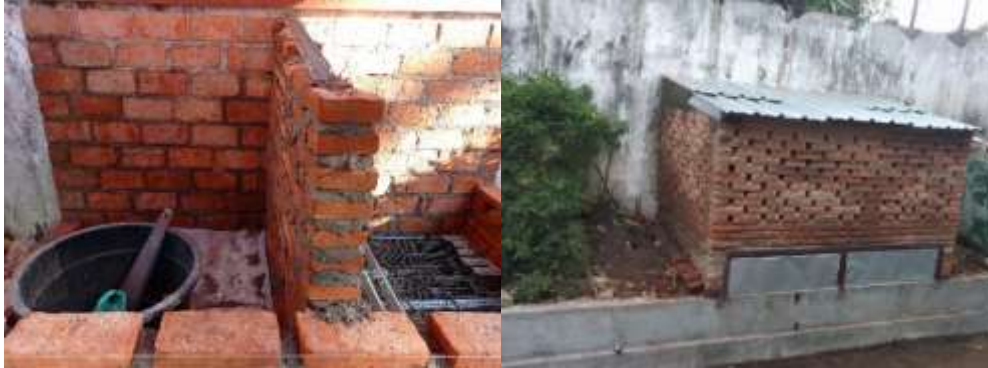
Gambar 1. Pembuatan Bata Terawang

Komposter bata terawang adalah sebuah metode pengomposan sampah organik dengan menggunakan prinsip aerobik, dimana diperlukan oksigen untuk aerasi. Komposter dibuat dengan menggunakan batu bata yang diberi rongga sebagai aerator. Proses pembuatan bata terawang dilakukan selama seminggu dibantu oleh cleaning service. Proses pembuatan bata terawang sebagaimana dimaksud diperlihatkan pada gambar