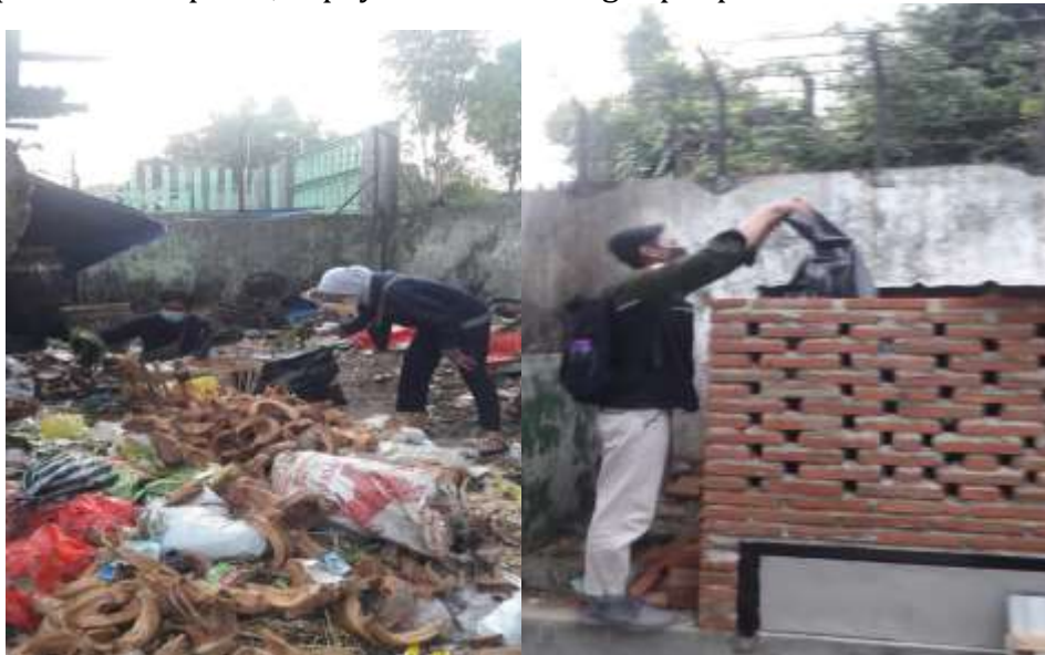
Gambar 4. Pengumpulan Sampah Organik

Pembuatan bata terawang membutuhkan waktu selama 2 minggu dengan ukuran 2 m x 1 m x 0,75 m. Bagian bawah dari bata terawang diberi saringan kawat dengan tujuan supaya saat kompos terbentuk, kompos yang dalam bentuk tanah bisa turun ke bawah, sedangkan yang utuh masih tetap berada di atas. Kompos bisa dipanen melalui bagian bawah bata terawang yang diberi pintu/lubang. Sampah organik yang dimasukkan dalam bata terawang ini terdiri dari daun-daun kering maupun basah, dan sayuran sisa. Sayuran sisa diperoleh dari pasar, supaya bata terawang cepat penuh.