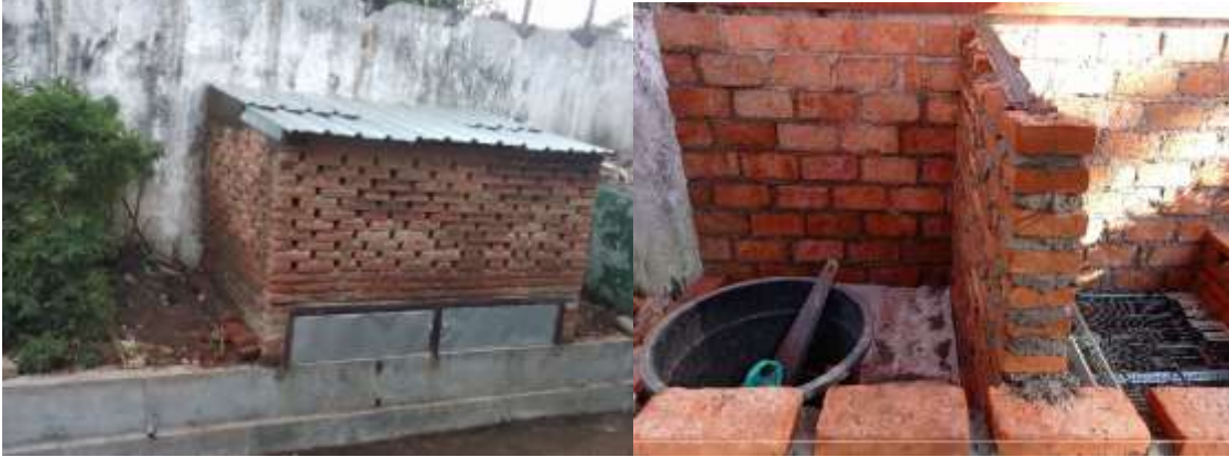
Gambar 3. Bata Terawang

sosialisasi/penyuluhan pembuatan kompos di STIKES Widyagama kepada para petugas kebersihan, karena kita ketahui bahwa banyaknya metode pembuatan kompos menjadikan petugas kebersihan bingung menerapkan.