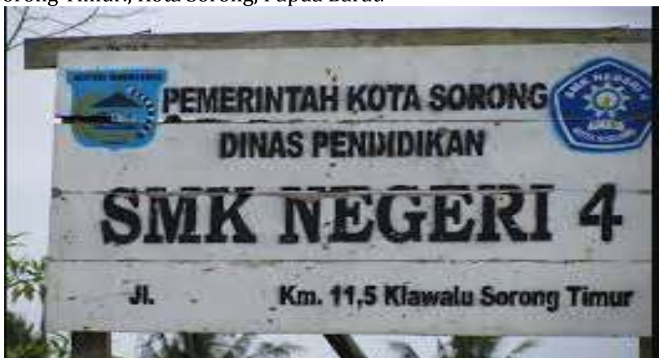
Gambar 1. Lokasi PKM

Lokasi pengambilan data dan pelaksanaan kegiatan Pengabdian Kepada Masyarakat adalah SMK Negeri 4 Kota Sorong dengan alamat Jln. Basuki Rahmat KM.12.5, Klasaman, Klamana, Sorong Timur., Kota Sorong, Papua Barat.