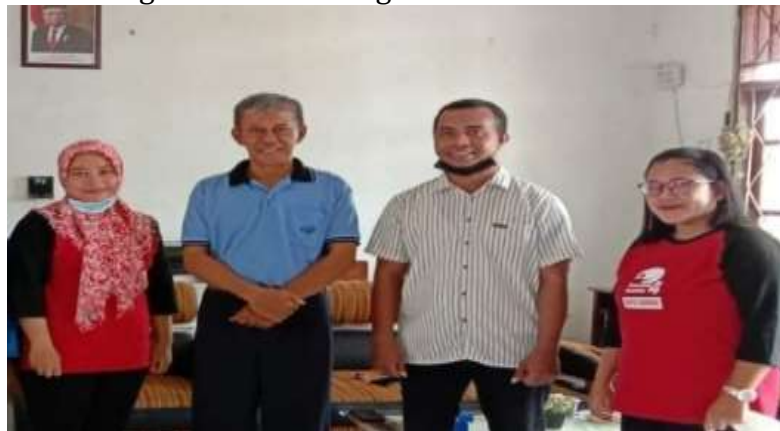
Gambar 3. Pelaksana PKM dengan Pihak SMK Negeri 4 Kota Sorong

Kegiatan Pengabdian yang dilakukan pada SMK Negeri 4 Kota Sorong memaparkan penjelasan mengenai sebuah sistem informasi absensi guru untuk menunjang bagian administrasi dari pihak sekolah. Kegiatan Pengabdian ini dilakukan secara langsung yang dilaksanakan pada SMK Negeri 4 Kota Sorong.