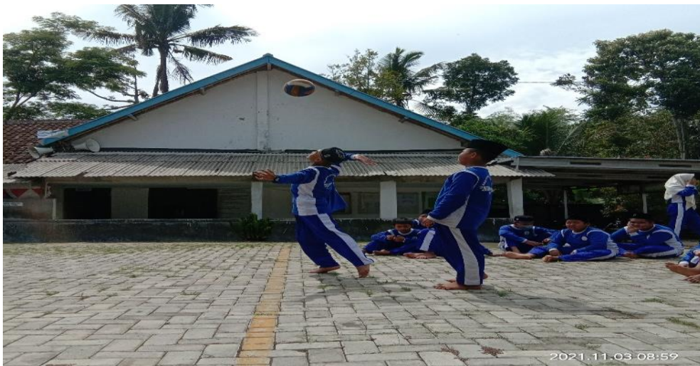
Gambar 2. Dokumentasi Kegiatan