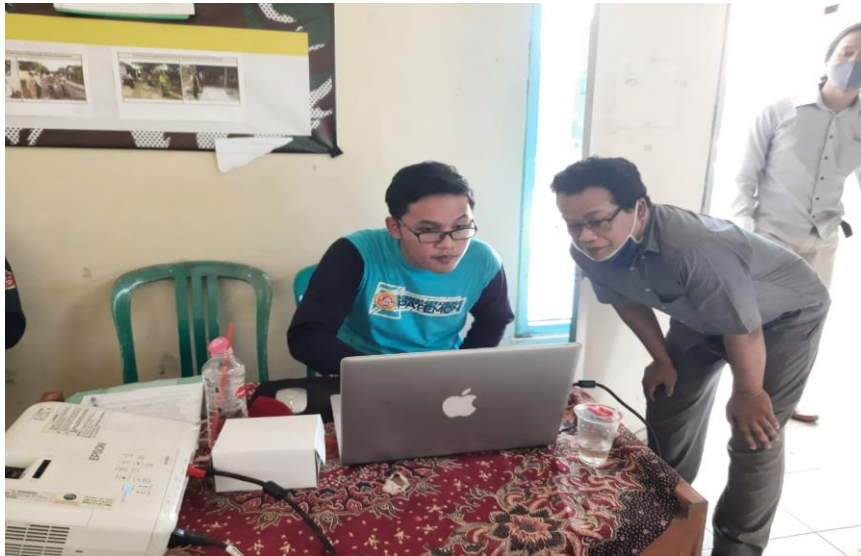
Gambar 3. Tim Pengabdian memberikan materi digitalisasi pada organisasi

Adapun materi yang disampaikan dalam sesi kedua ini adalah tentang langkah-langkah dalam Manajemen Organisasi yang menerapkan digitalisasi antara lain: