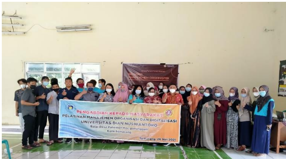
Gambar 1. Tim Pengabdian dan Peserta Kegiatan

Pada bulan Agustus 2020 Tim Pengabdian Kepada Masyarakat Prodi Akuntansi Fakultas Ekonomi dan Bisnis Universitas Dian Nuswantoro melakukan pendekatan awal dengan Karang Taruna Tunas Desa Patemon untuk mengadakan pelatihan manajemen organisasi dan digitalisasi sitem. Tim telah berperan aktif dalam beberapa kerjasama dan pemberdayaan masyarakat.