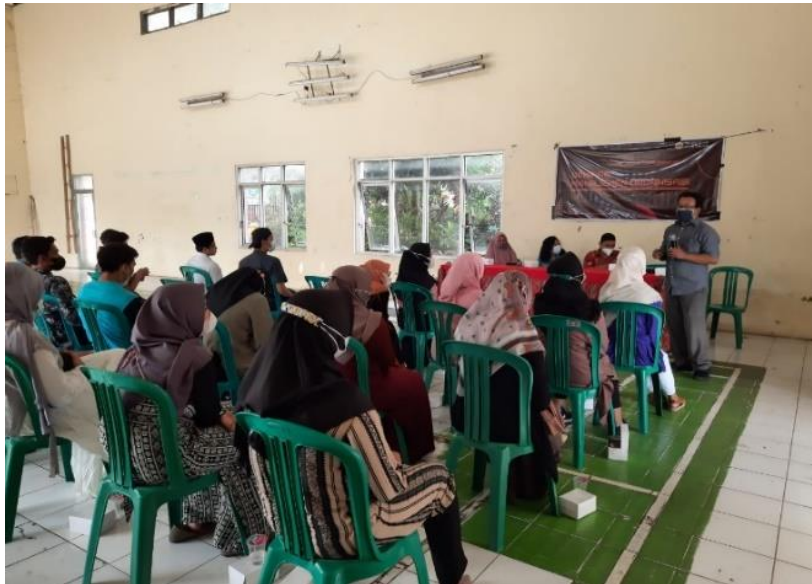
Gambar 2. Peserta menerima penjelasan materi dari tim pengabdian

Pada gambar 2 terlihat bahwa tim pengabdian sedang menyampaikan materi tentang manajemen organisasi di lingkungan karang taruna, disebutkan bahwa terdapat tingkatan dalam organisasi karang taruna yaitu: